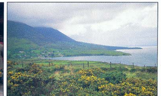
Kusten i Kerry.