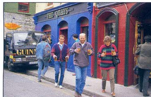
Öl-take away.